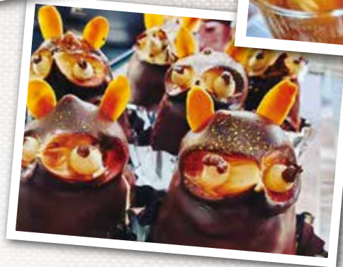
◀レトロな タヌキケーキ

大原の老舗「昭和堂洋菓子店」からは、季節のタルトをご紹介します。 フレッシュな生クリームと「旬のフルーツ」はベストマッチング!!どれも美味です。 現在は「シャインマスカット」と「ブルーベリー」のタルトがおすすめです!!(取材時はびわでした) 手土産も伊勢エビロールはじめ、いすみんシュー、マドレーヌ等充実です。 是非一度お立ち寄り下さい。コロナ禍の沈んだ気持ちも明るくなること間違いなしです!!