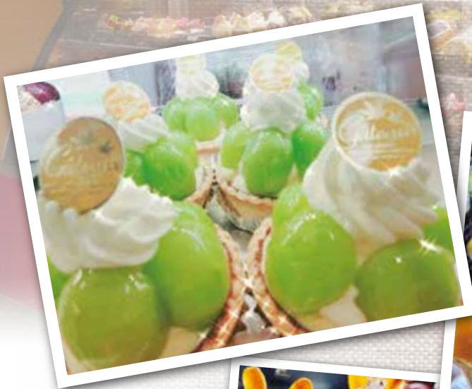
▲シャインマスカット タルト