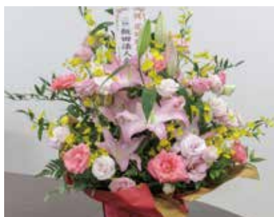
【写真】 左) 総会出席者 右) 飯田法人会より 届いたお花