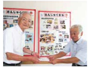
御宿町社会福祉協議会

毎年恒例のチャリティーボウリング大会を8月20日に実施いたしました。昨年は新型コロナの影響で2か月先延ばしでの開催でしたが、今年は状況改善された訳ではありませんが規制の緩和と環境に十分配慮しての開催でした。規模は昨年並みでしたが参加者の皆様には十分楽しんでいただけたと思います。