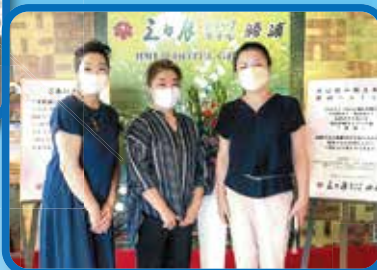
7/27 勝浦支部女性部会