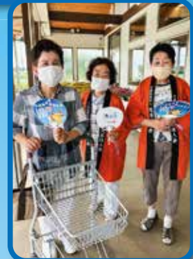
7/24 白子支部女性部会