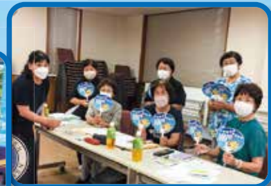
7/10 8/24他 大原支部女性部会