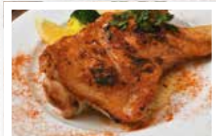
錦爽どりのオープン焼き