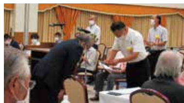
会員増強優良支部表彰