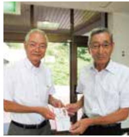
大多喜町社会福祉協議会