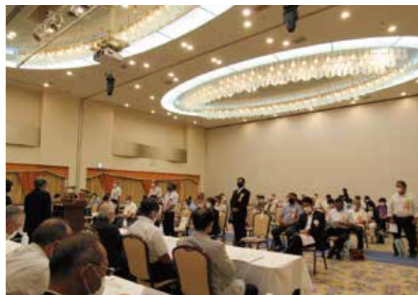
支部表彰代表の皆様

令和4年度役員大会が8月5日にホテル一宮シーサイドオーツカで、ご来賓に茂原税務署長をはじめ福利厚生制度推進3社から幹部の方々のご臨席を賜り盛大に開催されました。