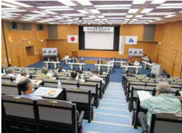
会員増強役員合同会議