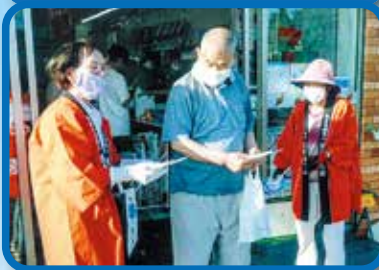
8/6 夷隅支部女性部会