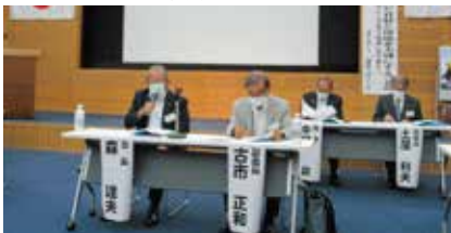
森会長と古市組織委員長