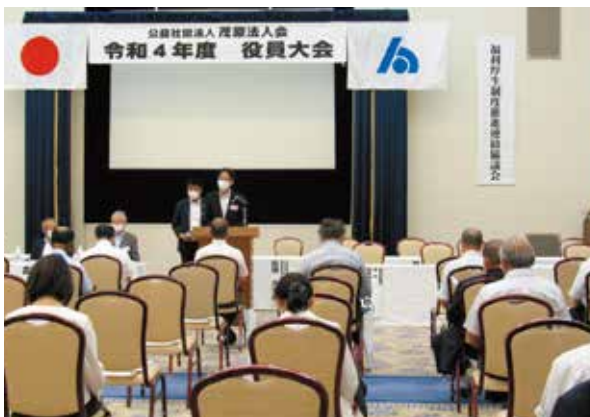
福利厚生制度推進連絡協議会開催