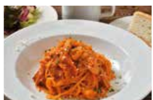
パスタセット アマトリチャーナ

※平日ディナータイムでのご利用をご希望の場合は完全予約制となっておりますので、ご利用日3日前までに当店へお問い合わせください。