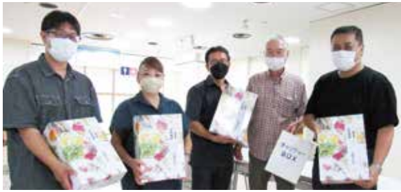
団体優勝 長生支部