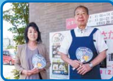
6/29 茂原支部連協女性部会

本年は、コロナ禍ではありますが、行動制限がない3年ぶりの夏となり、お店やイベント会場での人から人へのうちの配布とホテルや飲食店、病院や警察署などにうちのを置いていただくようお願いする活動となりました。