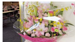
飯田法人会より届いたお花