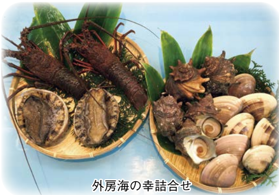
外房海の幸詰合せ